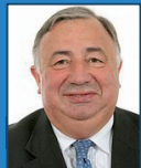
Gérard Larcher g.larcher@senat.fr RAMBOUILLET